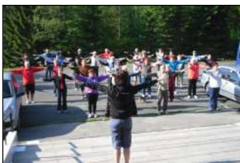
aktivizační pobyt Malá Morávka hotel Kamzík – senioři ranní rozcvička