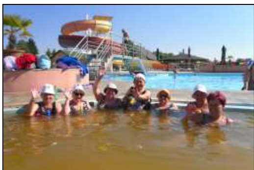
aktivizační pobyt Slovensko – Podhájská