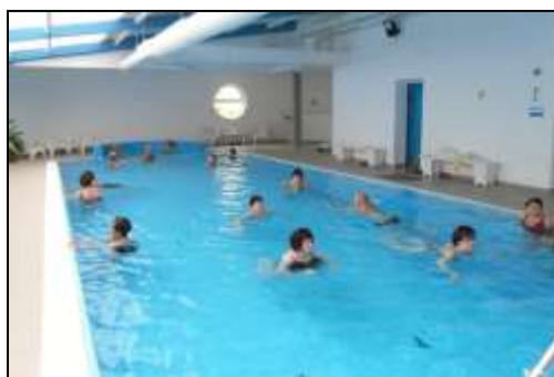
lázeňský pobyt Slovensko – Trenčianské Teplice