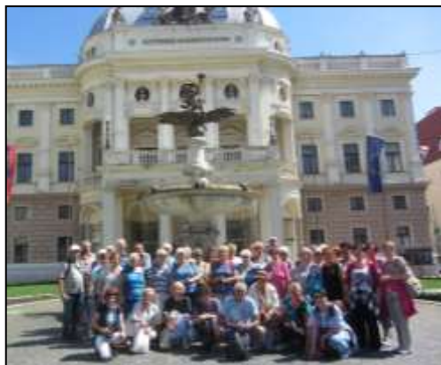
poznávací zájezdy – jednodenní Bratislava - Vídeň