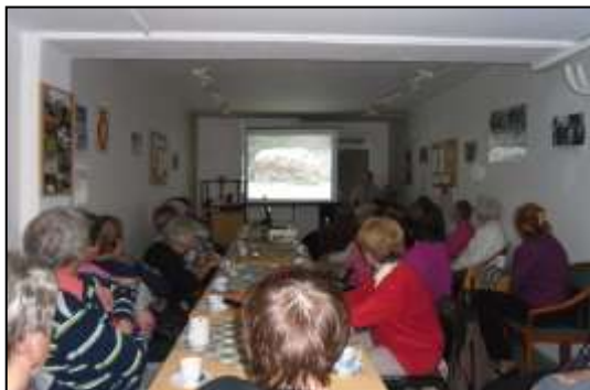
Zimní kavárna přednášky v INFO – Centrum