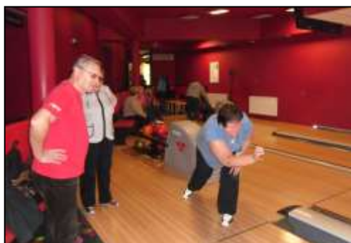
aktivizační činnost bowling