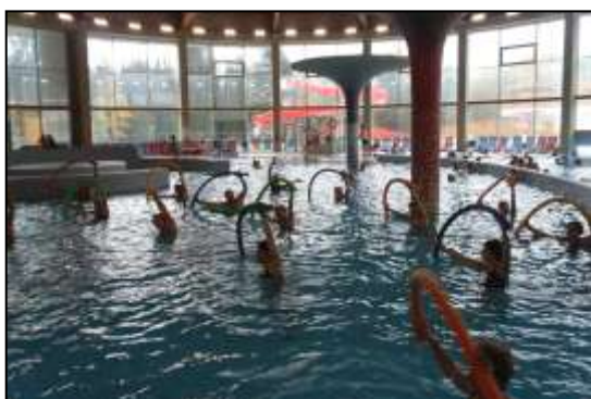
relaxační jednodenní zájezdy Velké Losiny