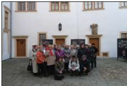
návštěvy výstav Přerovský zámek