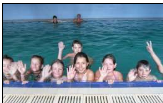
společně cvičíme a plaveme