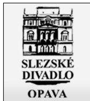
divadla Ostrava, Opava, Olomouc