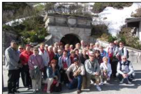
poznávací zájezdy – třídní ČR, Rakousko, Německo