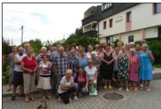
aktivizační pobyt Slovensko – Podhájská