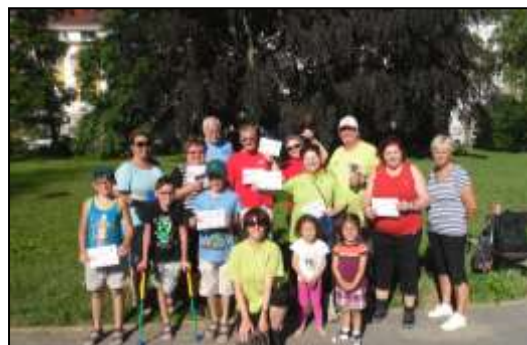
aktivizační činnost Alfaolympiáda 2016