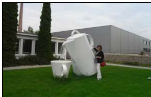
poznávací zájezdy– čtyřdenní Západočeské lázně – porcelánka Thun