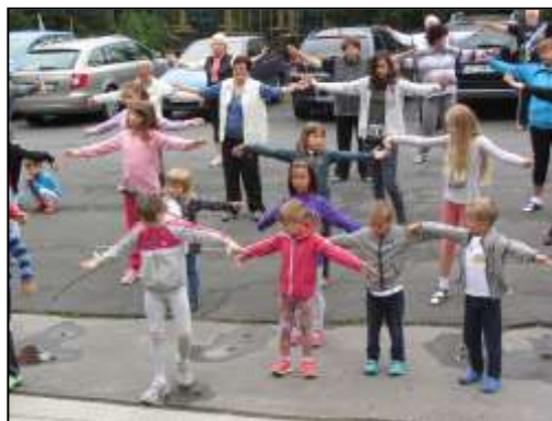
společně sportujeme – ranní rozvíčka