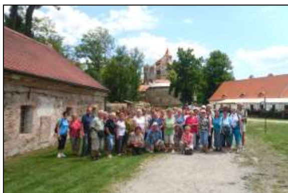
poznávací zájezdy – jednodenní hrad Pernštejn