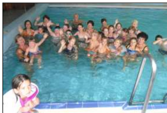
společně cvičíme a plaveme