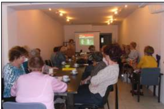
Zimní kavárna přednášky v INFO – Centrum