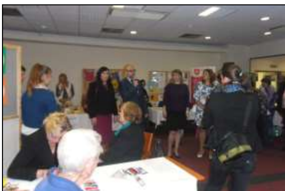
Senior symposium 2018