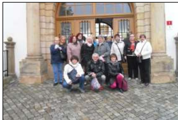
návštěvy výstav Přerovský zámek