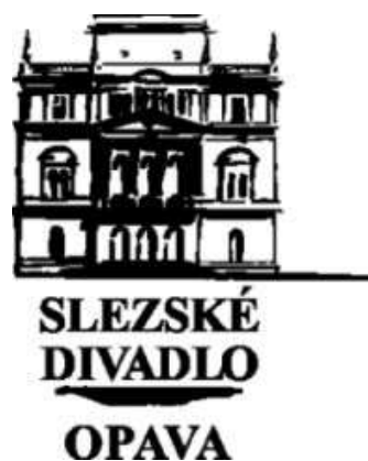
divadla Slezské divadlo Opava