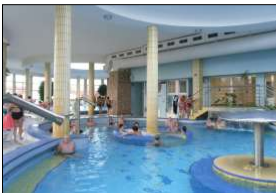
relaxační jednodenní zájezdy Dunajská Streda