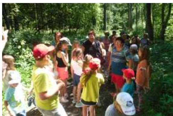
společná turistika cestou na mlýnky plníme vědomostní úkoly