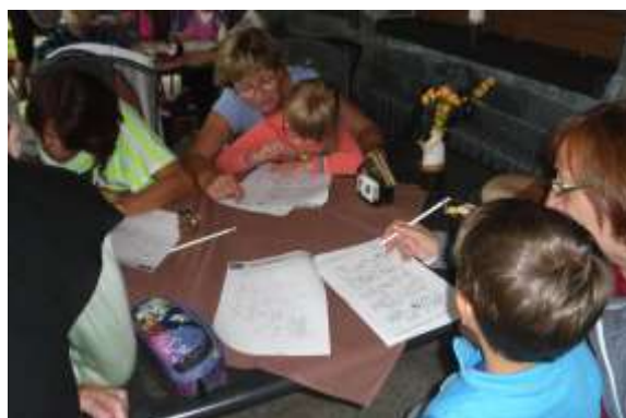
Všichni trénujeme paměť☺