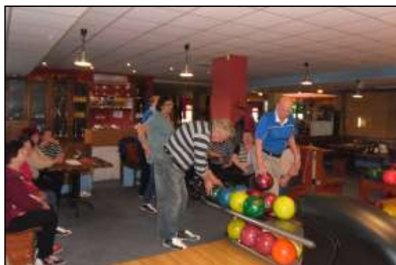
aktivizační činnost bowling