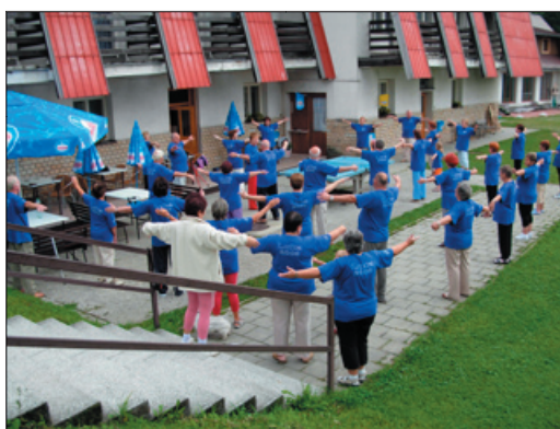
den jsme začínali krátkým protažením celého těla