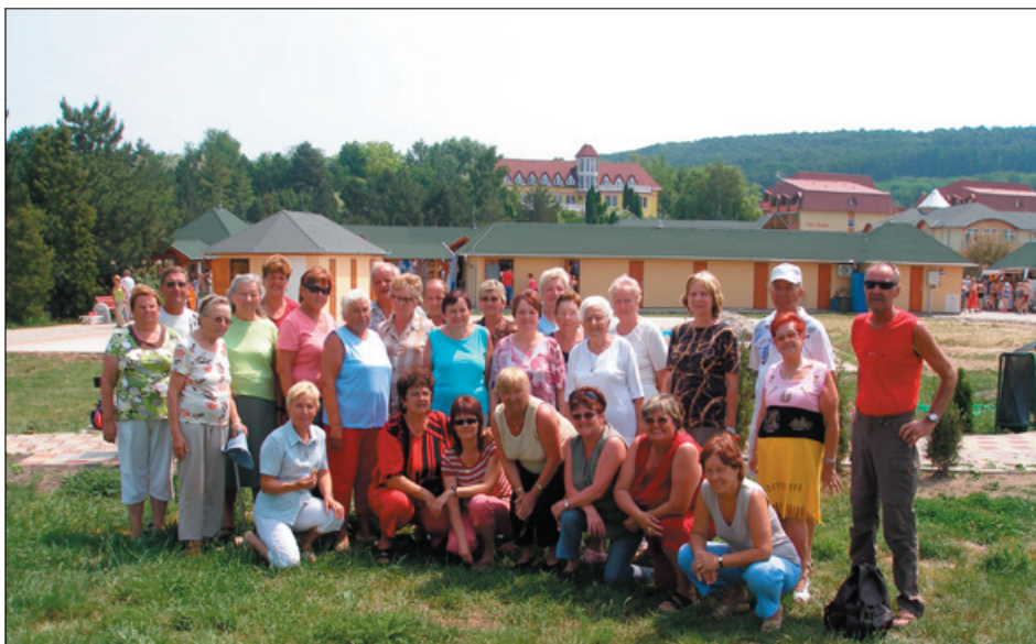
účastníci na Slovensku - Podhájska