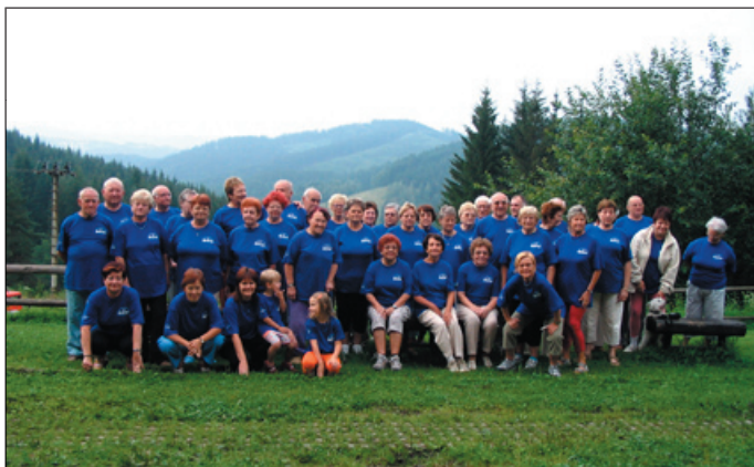
účastníci aktivizačního pobytu - „v našich tričkách“