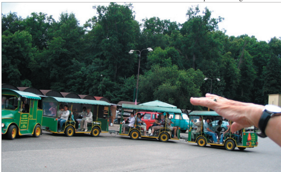
cesta vláčkem na zámek Konopiště