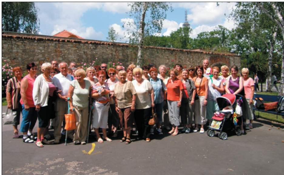
společná fotografie z Petřína