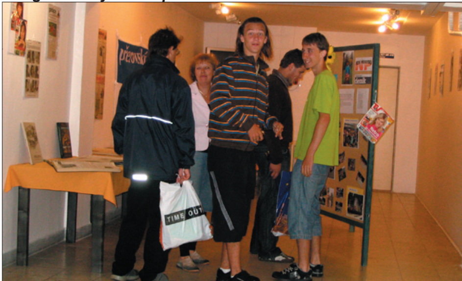
výstavka našeho člena V. Podušela ve spolupráci s NP Přerov