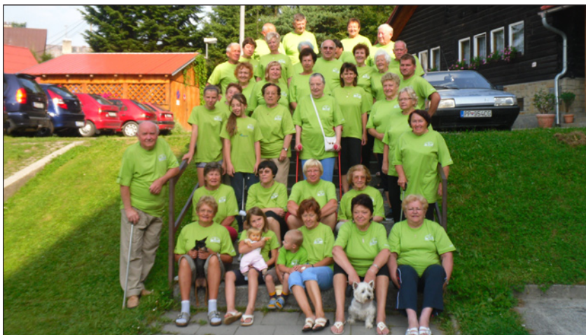
účastníci aktivizačního pobytu na Soláni - červenec