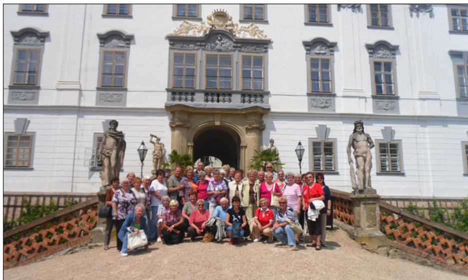
společná momentka před krásným zámekem v Lysicích