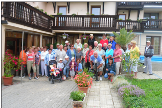
40 účastníků aktivizačního pobytu na Podhájské

užívali jsme si tepla, sluníčka i léčivou termální vodu