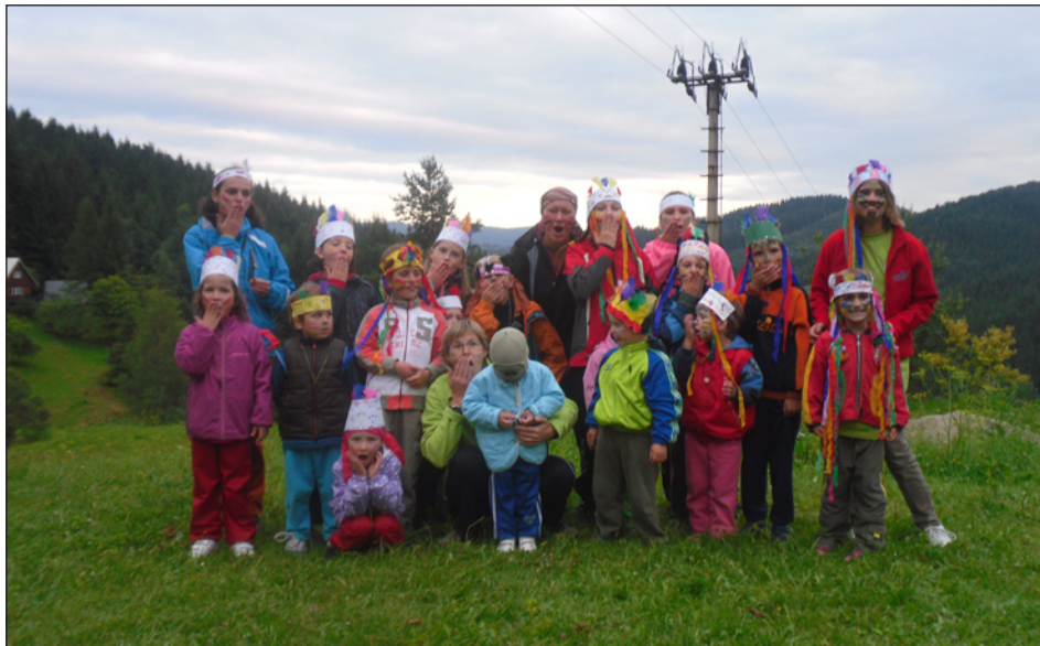
malí „indiáni“ v ručně vyrobených čelenkách