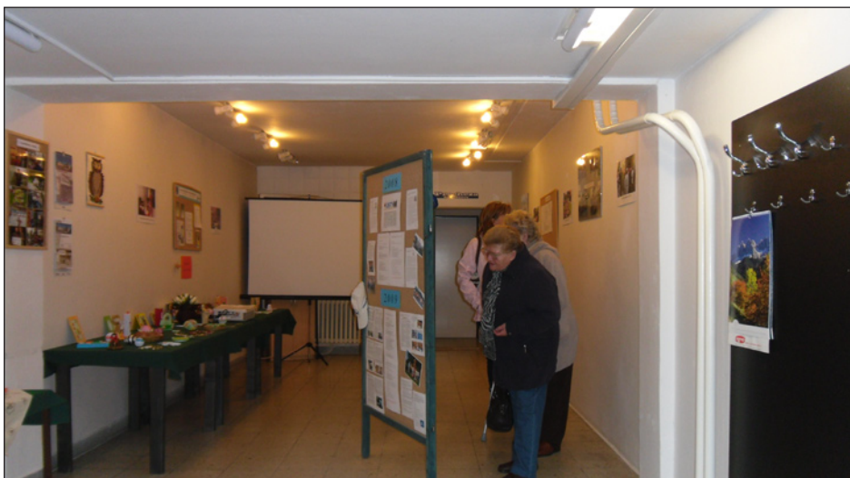
na Den otevřených dveří se přišla podívat veřejnost i členové organizace