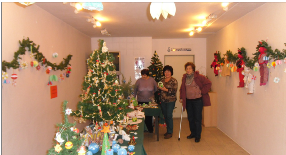
výstavka s vánoční tématikou