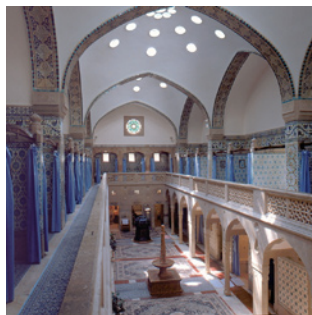
Nově zrekonstruované turecké historické lázně Hammam, kde vyvěrá pramen Sina