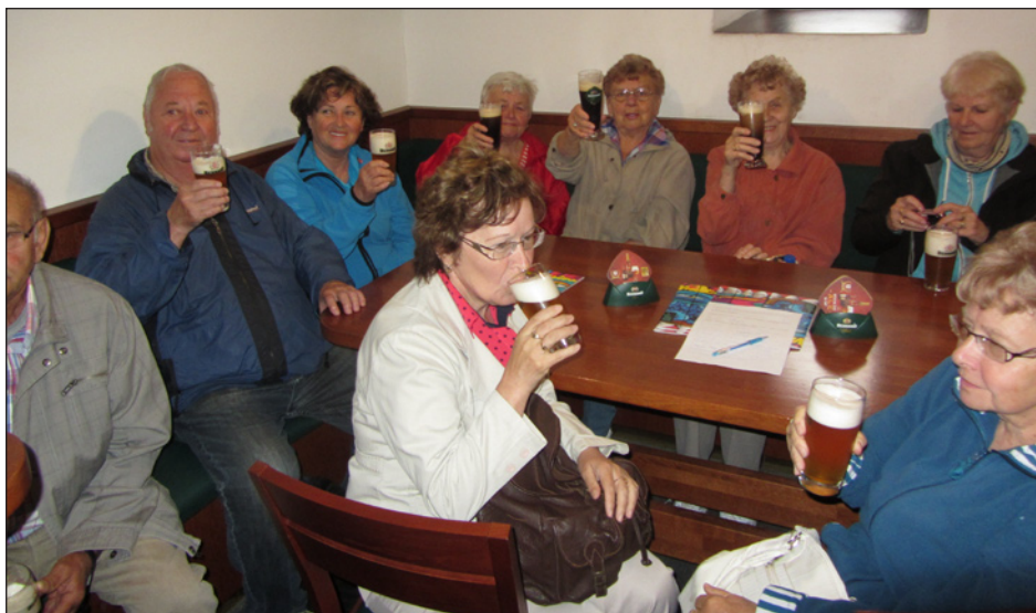
ochutnáváme výborné pivo BERNARDt