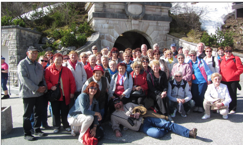
společná fotografie z třídeního zájezdu