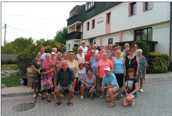
společná fotografie z ozdravného pobytu

Ubytování jsme měli velmi pěkné, vskusně zařízené, vybavené sociálním zařízením a televizí. Následovalo rychlé vybalování a příprava na první společnou večeři, která byla po celou dobu našeho pobytu stanovená na 17. 30 hodin.