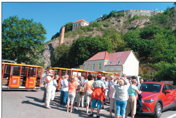
projížďka vláčkem ve Znojmě

Po této velmi zdařilé části dne se blížil čas oběda. Restaurace nedaleko radniční věže potrápila svým umístěním ve druhém patře, ale všichni tuto překážku zvládli a byli odměněni výborným obědem, po kterém chutnalo znojemské pivo. Takto řádně posílnění a odpočati jsme nasedli do autobusu a zhruba po půl hodině jízdy jsme přijeli k Vranovské přehradě, kde jsme měli rezervovanou projížďku lodí.