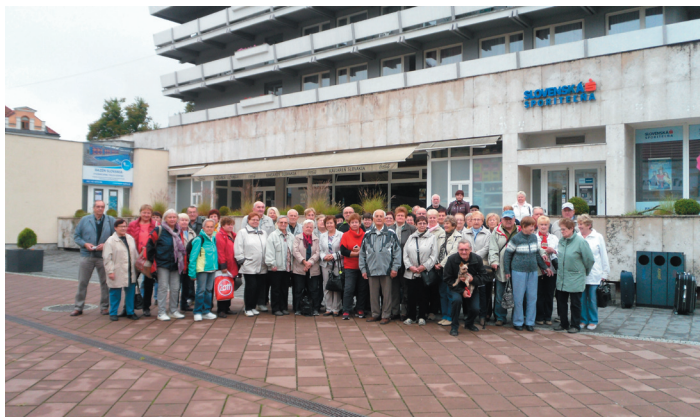
společná fotografie všech 62 účastníků

Kaváren k příjemnému posezení je zde dostatek,