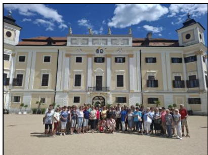
poznávací jednodenní zájezd Milotice, Strážnice