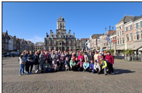
vícedenní poznávací zájezd Benelux