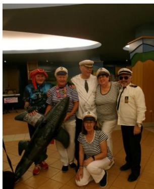
ukončení roku SILVESTR